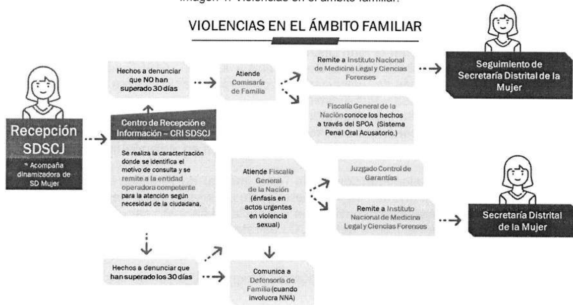
Imagen 1. Violencias en el ámbito familiar.